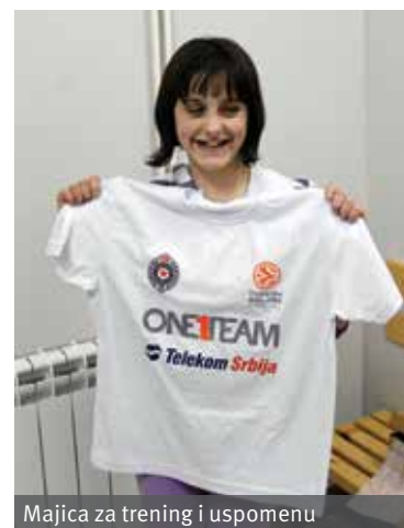
Majica za trening i uspomenu