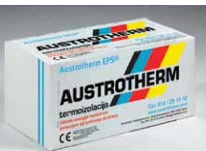
Austrotherm EPS A EKONOMIK

Austrotherm d.o.o. predstavništvo Beograd SRB - 11030 Beograd Arčibalda Rajsa 27 Email: sava.milosevic@austrotherm.rs