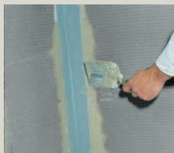
Austrotherm UNIPLATTE - Izrada pregradnih zidova