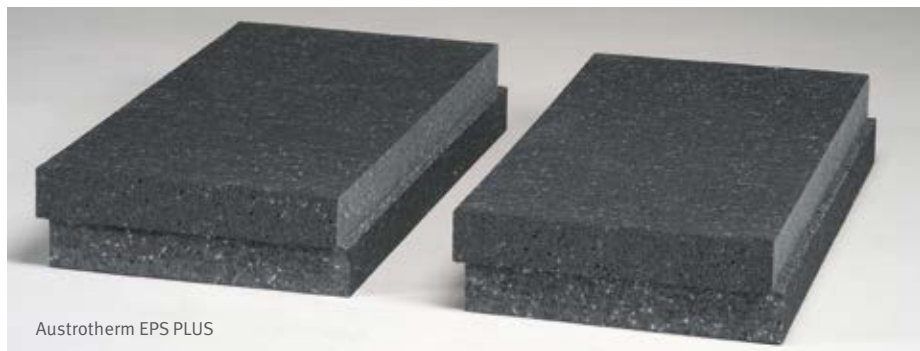
Austrotherm EPS PLUS