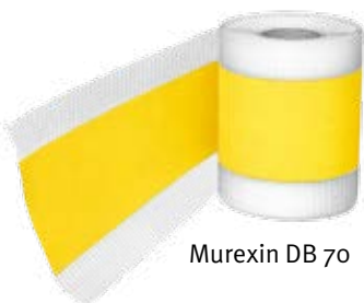
Murexin DB 70