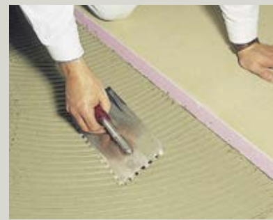
Austrotherm UNIPLATTE - jednostavna obrada

u obliku tzv. pogača na poledinu ploče. Lepak odlično prijanja na ploču, bez obzira da li je podloga estrih („košuljica“) ili beton. Ukoliko podloga nije noseća, onda se Austrotherm UNIPLATTE mora tiplovima pričvrstiti za nju.