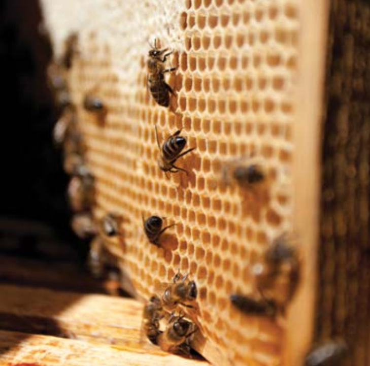
I pčelama odgovara: lakši život uz polistiren.