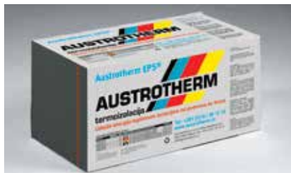
Austrotherm EPS® AF PLUS

Termoizolaciona ploča Austrotherm EPS® AF PLUS predstavlja najkvalitetniju varijantu termičke izolacije fasade objekta. To je ploča na bazi EPS-a („stiropora“) koja je obogaćena primesama grafita , a one ploči daju ne samo karakterističnu sivu boju, već i što je mnogo bitnije - i do 20% bolja termoizolaciona svojstva u odnosu na ekvivalentni „beli“ EPS!