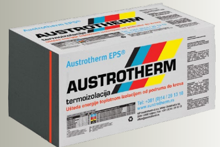
Austrotherm EPS® AF PLUS

Austrotherm d.o.o. Mirka Obradovića bb SRB - 14000 Valjevo Tel: +381 (0)14 29 13 10 Tel: +381 (0)14 29 13 11 Fax: +381 (0)14 29 13 13 office@austrotherm.rs www.austrotherm.rs