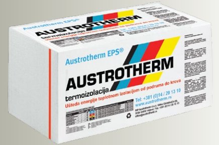
Austrotherm EPS® AF